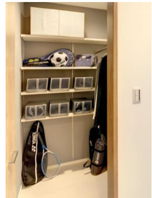
お出かけクローゼット