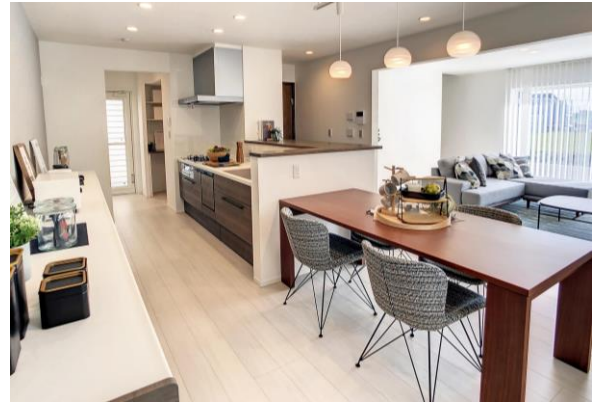
Famisto ノイエ モデルハウス内観

ネーミングは、Family+Storage の造語となります。特徴としては、キッチンと玄関すぐそばに2WAYの大型パントリーを配置したことで、「玄関ホール」→「パントリー」→「キッチン」へとスムーズにアクセスでき、モノをしまう、取り出す、といった負担を軽減することができます。