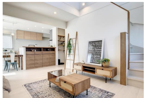
Famiclo ノイエ モデルハウス内観

ネーミングは、ファミリークローゼットの略語からきています。特徴としては、ランドリースペースを設けて、洗う→干す・乾かす→しまうの家事動線をコンパクトにしています。「キッチン」→「ファミリークローゼット」とつながる「ランドリールーム」+「洗面室」→「リビング・ダイニング」に回遊性を持たせることで、家事効率のアップを実現しています。