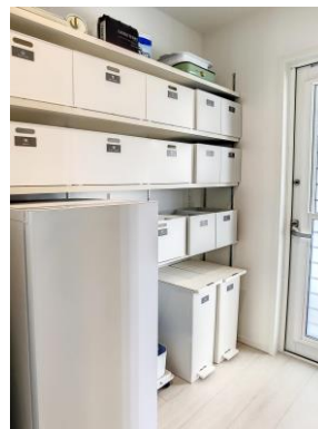
パントリー（キッチン側）