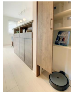
キッチン前面収納