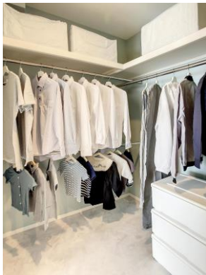
ファミリークローゼット

玄関ホールの側に「お出かけクローゼット」を配置しています。内部にはコートがかけられるのはもちろん、カバンやお子様が部活で使うスポーツ用具なども置くことができます。帰宅後にコートやカバンが LDK に置きっぱなしになることもありません。