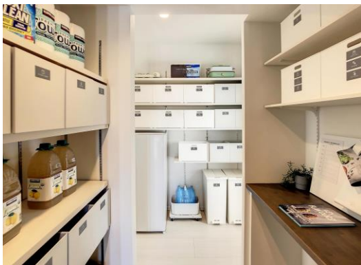
パントリー（玄関ホール側）

リビング側には、キッチン前面収納を配置。玄関ホール付近の収納上部は扉付きとなっているので、LDK で使う日用品や常備薬などの指定席に最適です。下部には、お掃除ロボットの充電ステーションとして使えるようにコンセントも設けています。