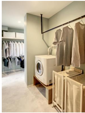
ランドリールーム