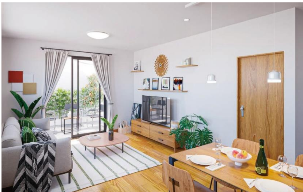
※28号棟モデルハウス「ロジアの風景を楽しむ邸」

LDKは、家族が自然と集まる伸びやかな空間です。中でも開放感のあるオープンキッチンは回遊性を持たせ、家事動線をスムーズにします。また、リビングとつながる「ロジア」は、自然とのつながりを感じる贅沢なアウトドアスペースです。シャワー付き水栓柱が設置されているので、海で遊んだ後やサーフィンの後に利用できるのが便利です。2階ホールには、カウンターを備えたマルチスペースがあり、雨の日の室内物干しスペースとしても活用できます。さらに、マルチスペースからつながるバルコニーは、家族でくつろげるゆとりの広さを確保しています。その他、キッチン前面の収納やパントリーなど、各所に配置された充実の収納スペースがあり、整理整頓ができるスマートな暮らしが叶います。