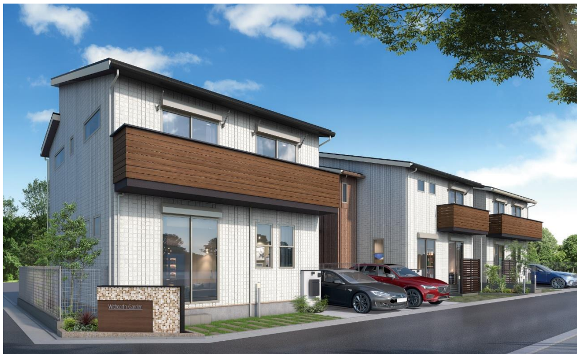
※「ウィザースガーデン湘南平塚」街並み完成予想図

新昭和イクスとして神奈川県エリア初進出となる当分譲地「ウィザースガーデン湘南平塚 悠久の街」は、「自分らしく暮らす、家族時間を楽しく」をコンセプトに、家族と個の時間を上質に彩るこだわりの住空間をプランニング。さらに、外壁タイル貼りや太陽光発電システムをはじめ、環境に配慮した設備・仕様を備え、ここで住まうご家族の快適な暮らしを叶えます。